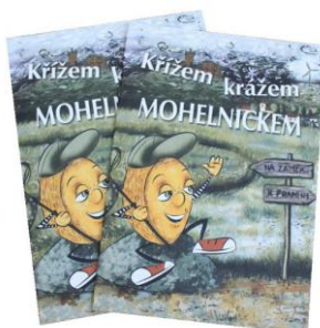
Sešit Křížem krázem Mohelnickem