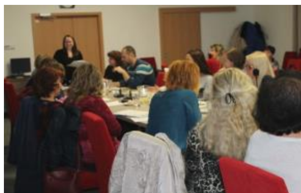
Jednání Řídícího výboru