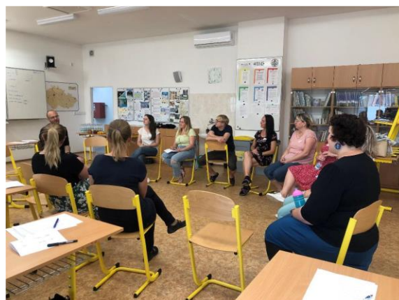
ukázky z realizovaných workshopů, seminářů, webinářů