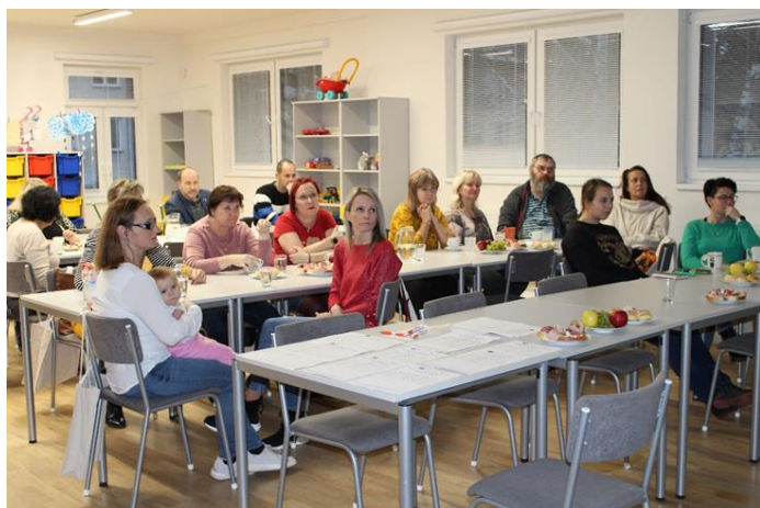
jednání Pracovních skupin