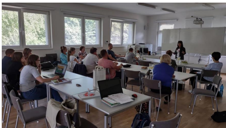
Jednání pracovních skupin a místních lídrů s odborníkem z praxe