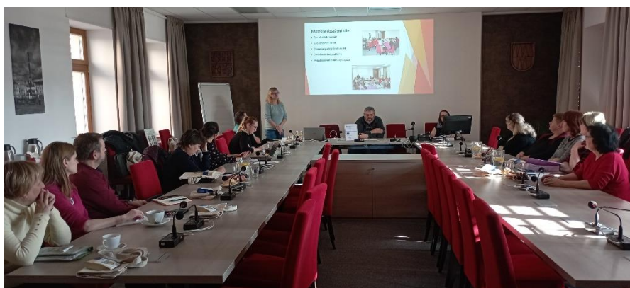
jednání Řídicího výboru

sešel osobně třikrát, a také probíhalo korespondenční hlasování dle aktuální situace důležitých dokumentů. Proběhlo schvalování/aktualizace dokumentů, které jsou nezbytné pro realizaci projektu, např. dokument Statut či Roční akční plány na roky 2023, 2024 a 2025. Jednou z pravidelných a důležitých aktivit Řídicího výboru je schvalování strategického dokumentu „Strategický rámec MAP Mohelnicko III do roku 2025“ (SR MAP). Součástí SR MAP je „Seznam investičních priorit ORP Mohelnice“. Jedná se o tabulky, do kterých školy a jejich zřizovatelé zařazují své investiční záměry, aby na ně následně mohli čerpat finanční prostředky z externích zdrojů. Tato aktualizace probíhá pravidelně nejdříve po 6 měsících od poslední aktualizace, jak udává metodika MŠMT. Poslední aktualizace byla realizována dne 27. 6. 2023 a dohledat ji můžete na webu masmohelnicko.cz v záložce MAP III, dokumenty.